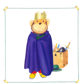
and dressing up.