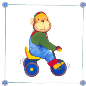
and riding my bike.