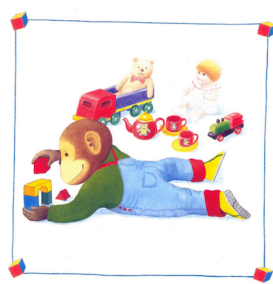
Playing with toys ...